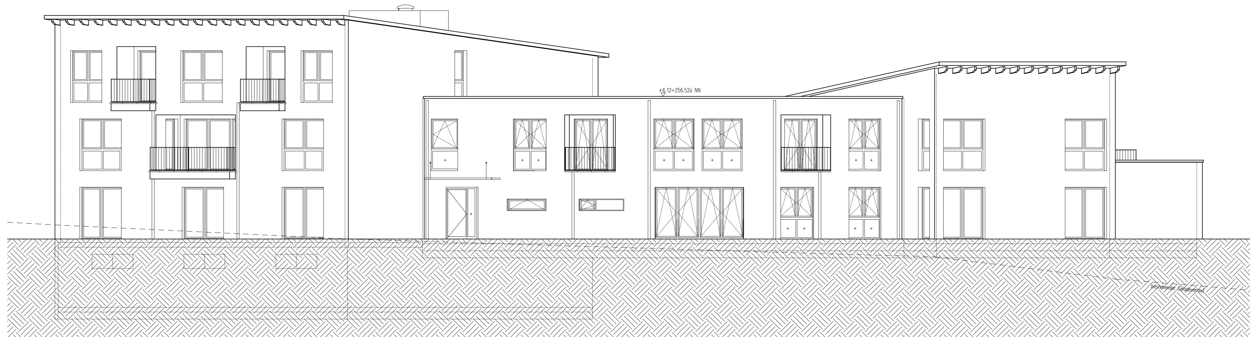
ANSICHT SUDWEST I