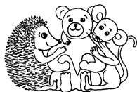
Bären-, Igel-, Mäusegruppe