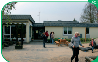
Kath. Kindertagesstätte St. Engelbert