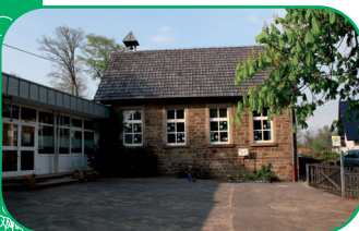
Kath. Kindertagesstätte St. Mariä Himmelfahrt