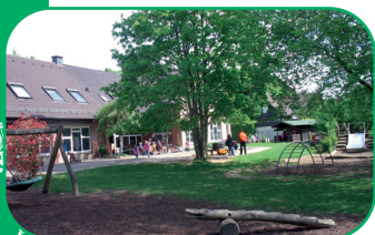
Caritas Familienzentrum Odenthal

Die Angebote der Kindertageseinrichtungen und die familienpastoralen Angebote der beiden Pfarrgemeinden sind in großen Teilen miteinander vernetzt und stehen allen Familien in Odenthal offen.